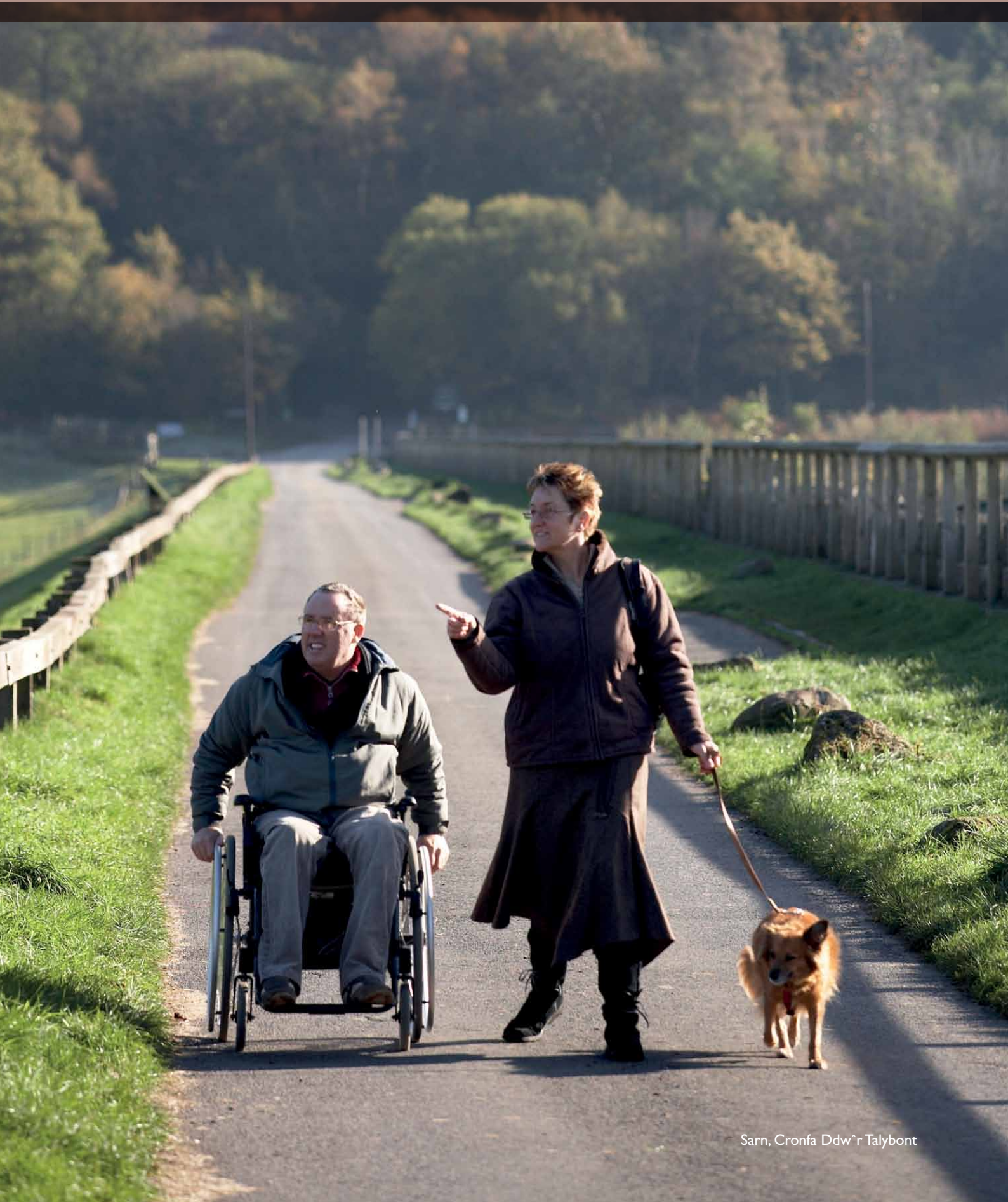
Sarn, Cronfa Ddw'r Talybont