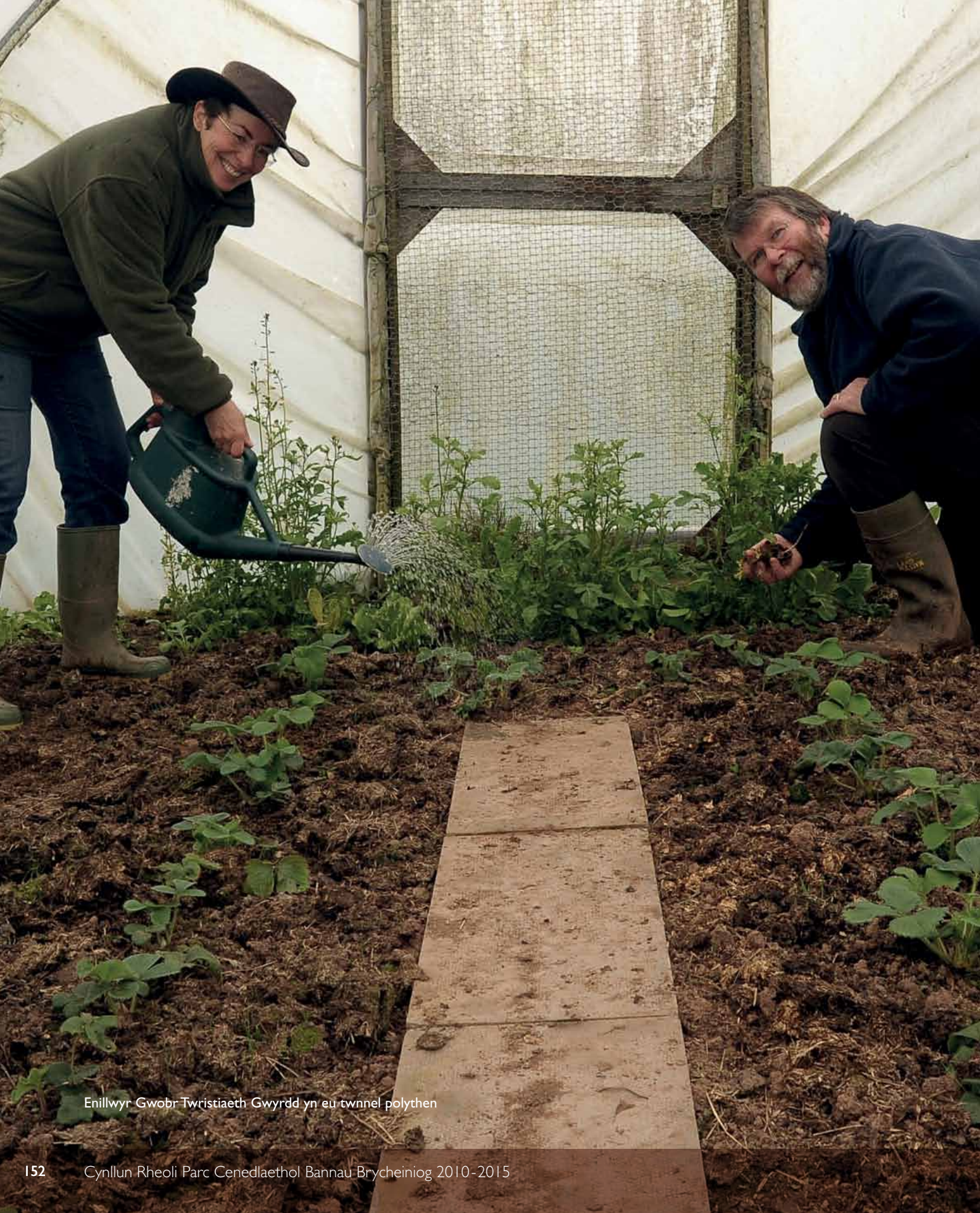
Enillwyr Gwobr Twristiaeth Gwyrdd yn eu twnnel polythen